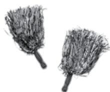
Pam White Health Net

Buscar soluciones para la salud de los californianos. No es sólo nuestro trabajo. Es nuestra pasión.